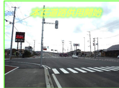
本荘道路供用開始