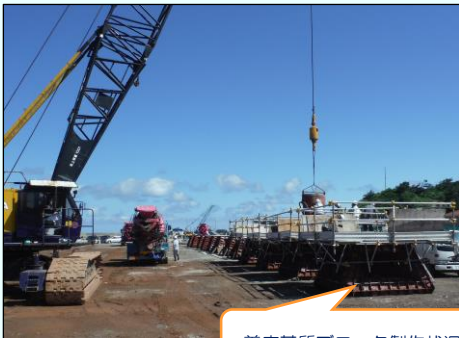
着底基質ブロック製作状況