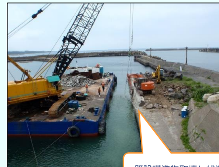
既設構造物取壊し状況